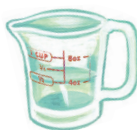
Copo de medidas