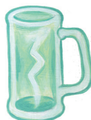
Caneca para cerveja